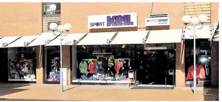
Sport Keil im City Center bietet ein riesiges Sortiment an Kleidung und Equipment für den Sport- und Freizeitbereich.