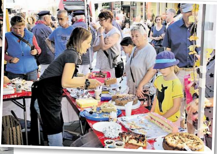
Montessori: Die Vereine beteiligen sich rege am ersten Tag der Ortsteile - und sind begeistert.