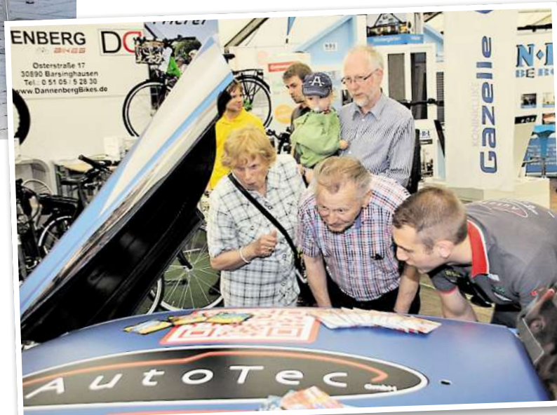
Die Autoschau ist weiterhin ein Besuchermagnet. Erstmals wurde sie zusammen mit einer großen Gewerbeausstellung ausgerichtet.

Barsinghausen. Das Jahr 2017 ist für die Mitglieder von Unser Barsinghausen bisher sehr erfolgreich verlaufen. Der Stadtmarketingverein kann auf eine Reihe von (Groß-)Veranstaltungen zurückblicken, mit deren Organisation die Mitglieder ihre Ziele erreicht haben. Die erste Ausstellung für Mobilität und Wirtschaft (MoWi) ist seit einigen Tagen Geschichte, mehrere Tausend Menschen besuchten die Barsinghäuser Innenstadt,