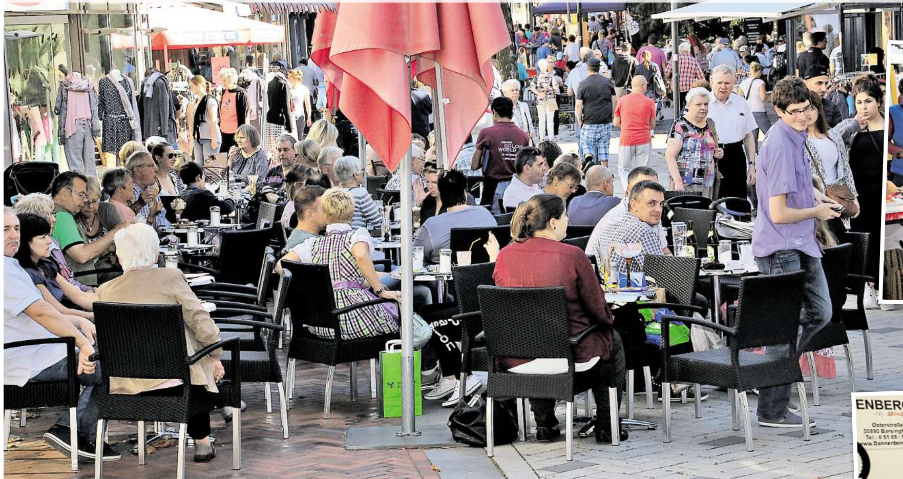
MoWi wie auch der Tag der Ortsteile locken tausende Besucher in die Barsinghäuser Innenstadt.

Unser Barsinghausen ruht sich nicht auf Erfolgen aus - Zweiter Tag der Ortsteile ist bereits in Planung